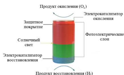
Рисунок 1 – Схема генерации водорода в фотоэлектрической батарее

В водородной солнечной панели процесс получения водорода основан на электролизе воды в нанометровых масштабах. При этом коэффициент полезного действия электролизёров составляет около 30 %. Данный показатель относительно низкий, поэтому для увеличения КПД необходимо внедрение наноэлектролизёра, площадь поглощения которого позволяла бы поглотить большее количество солнечного света для генерации водорода. В результате исследований было предложено 6 вариантов экспериментальных наноэлектролизёров, которые одновременно выполняют функции поглощения солнечного света и разложения воды на водород и кислород (рис. 2).