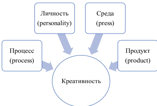
Рис. 2. Четырехмерная модель креативности М. Роудса (4P) [6]

В литературе отмечается, что процесс, в котором задействована креативность, возможен только в том случае, когда человек осознает свои действия, поступки, понимает их следствие и пути улучшения своей деятельности [7].