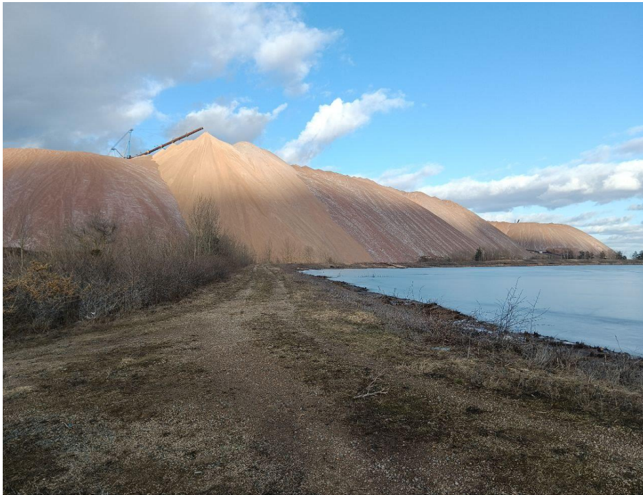
Рис. 1. Вид на солеотвал 1РУ ОАО «Беларуськалий» с дамбы шламохранилища