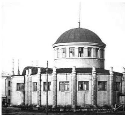
2.8 – главный павильон, Гродно [10]