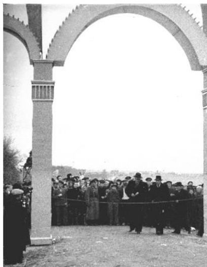
2.1 – арка входа, Минск [5, л. 1]