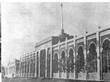
2.6 – главный павильон, Брест [8, л. 1]