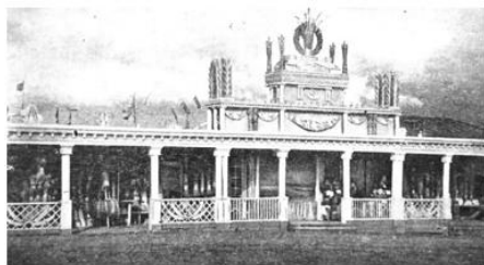
2.5 – павильон Кореличского р-на, Гродно [7]