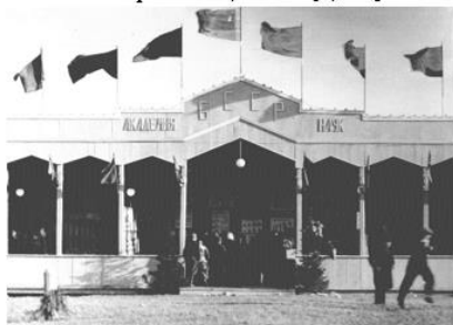
2.3 – павильон Академии наук БССР, Минск [5, л. 21]