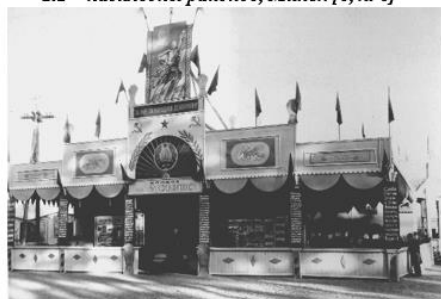
2.4 – павильон к-за им. Гастелло, Минск [6, л. 23]