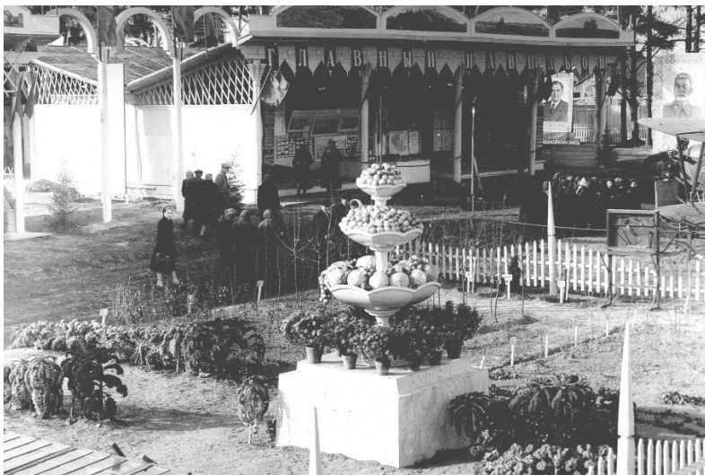
Рисунок 1 – Главный павильон Минской областной сельскохозяйственной выставки, 1953 г. [5, л. 11]

Вначале выставочные павильоны возводили, в основном, из легких каркасных деревянных конструкций с обшивкой стен досками и фанерой. Большинство павильонов были открытого типа, когда по главному фасаду имеется только галерея на столбах, поддерживающих крышу. Это позволяло сделать экспозицию укрытой от атмосферных осадков, упрощало посетителям обозрение экспонатов. Элементы каркаса и обшивка стен получали эффектное декорирование, свойственное объектам парково-рекреационной архитектуре (Рисунки 2.2–2.6). Но такие конструкции достаточно быстро приходилось обновлять и ремонтировать, на что требовалось изыскивать дополнительные финансирование и строительные материалы. Закрытых павильонов, со стенами по всему периметру, было немного.