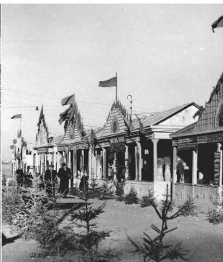
2.2 – павильоны районов, Минск [6, л. 6]