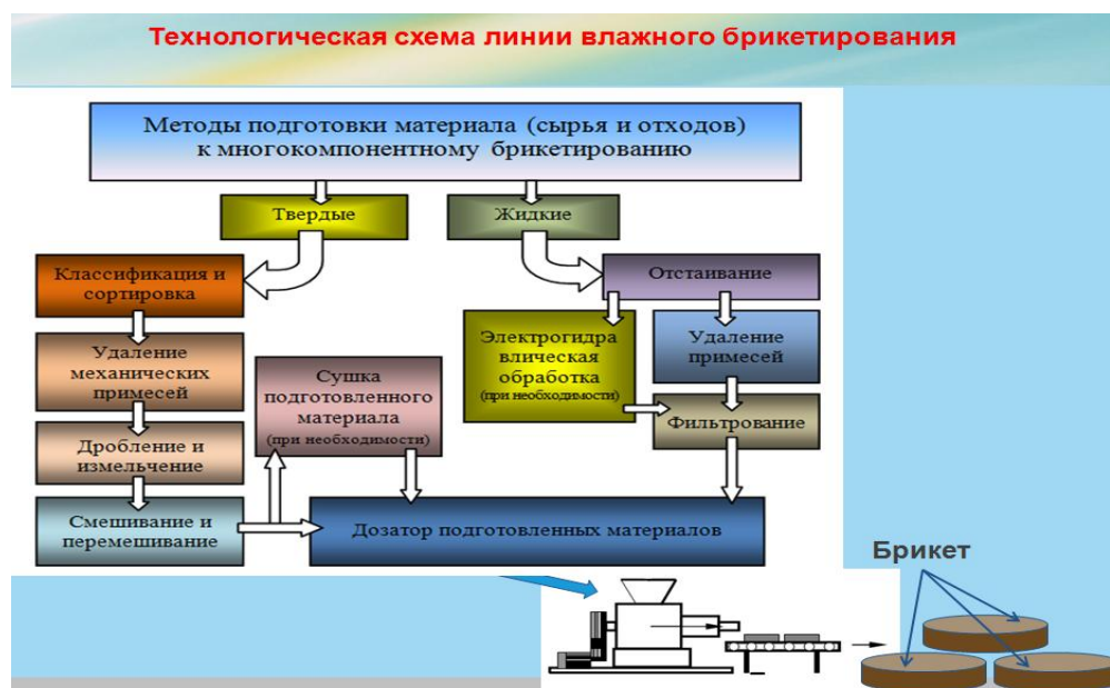
Рис. 1. Технологическая схема подготовки и брикетирования MSF топлива

Реализуемая схема разработанного процесса брикетирования в упрощенном виде состоит из следующих операций, представленных на рис. 1.