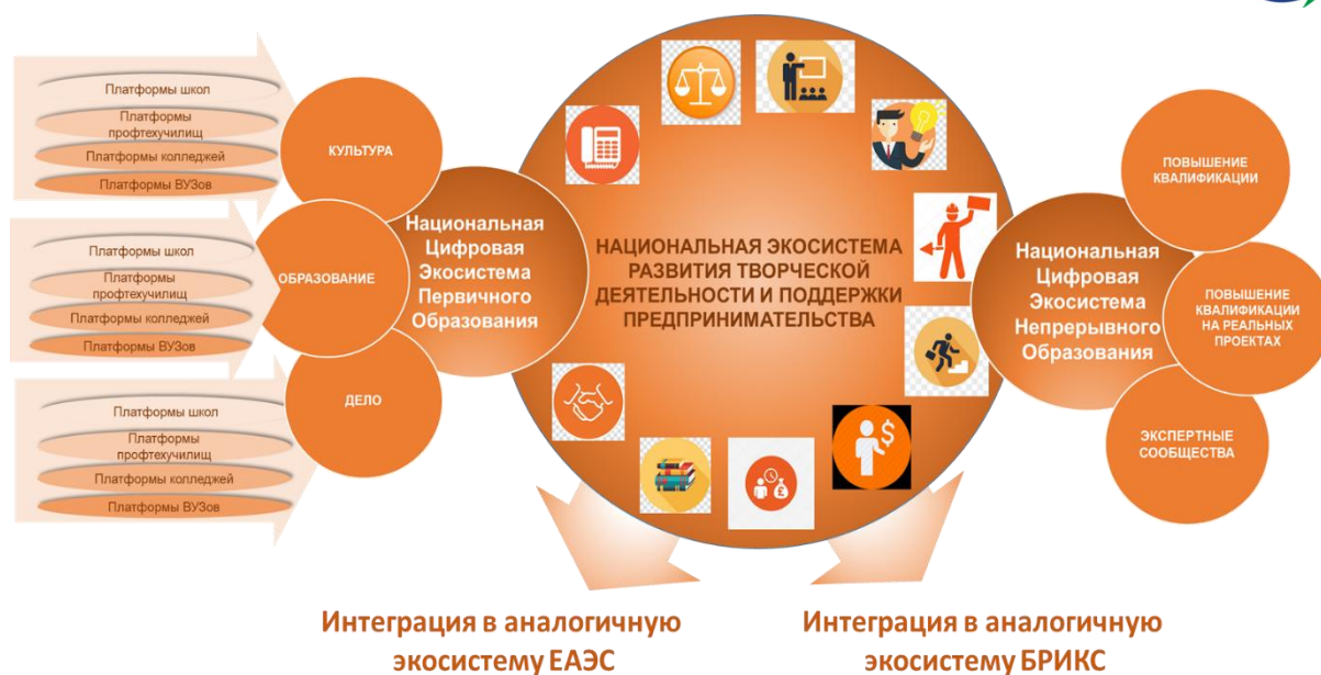
Рис. 3. Модель формирования экосистемы образования на основе цифровых информационно-коммуникационных технологий [20, с. 14, рис. 5]

Заключение. Акценты конкурентоспособности человека, предприятия и национальной экономики смещаются в пространство когнитивной деятельности. В этой связи, развитие системы образования переходит в разряд основного фактора обеспечения национальной конкурентоспособности, а, следовательно, и устойчивого развития государства, обеспечения его безопасности. Заметим, что качество преподавательских кадров в этом процессе будет иметь определяющее значение как ключевой фактор построения экономически и социально устойчивого суверенного государства.