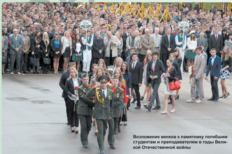
Возложение венков к памятнику погибшим студентам и преподавателям в годы Великой Отечественной войны