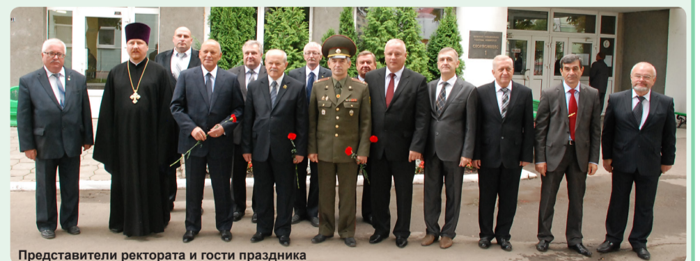
Представители ректората и гости праздника