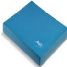
Рис. 1.2.«Подушки» – небольшие резиновые маты

- «подушки» – небольшие резиновые маты (рис. 1.2);