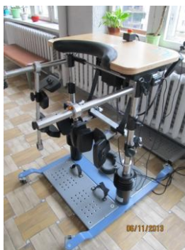
Рис. 1.7. Тренажер баланса

Тренажер баланса (рис. 1.7), используемый для восстановления функции равновесия у пациентов с разнообразной неврологической патологией, представляет собой платформу с упорами для стоп, соединенную со столом, располагающимся на уровне таза пациента. Помещенный в тренажер пациент фиксируется на уровне стоп и таза. Имеются также коленопоры, позволяющие использовать аппарат и для пациентов с нижней параплегией. Соединение платформы и стола может быть как неподвижным, позволяющим адаптироваться к вертикальному положению в статике, так и подвижным для динамической тренировки равновесия. Угол колебаний стола может устанавливаться в пределах от 6 до 12°. Таким образом, смещая стол за счет движений туловища на заданный угол в различных направлениях (вперед/назад, в стороны, по кругу) пациент осуществляет как тренировку функции равновесия, адаптацию к вертикальному положению и угловым ускорениям, так и способствует тренировке мышц туловища и нижних конечностей, восстановлению их опороспособности, профилактике остеопороза и контрактур, активизации системы кровообращения и функции тазовых органов.