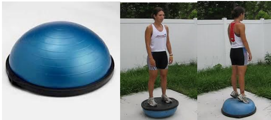
Рис. 1.3. Эластичные полусферы из резины, наполненные воздухом

– эластичные полусферы из резины, наполненные воздухом («BOSU» – «Both Sides Up»), балансировка и выполнение упражнений на которых возможно на обеих сторонах платформы (рис.1.3);