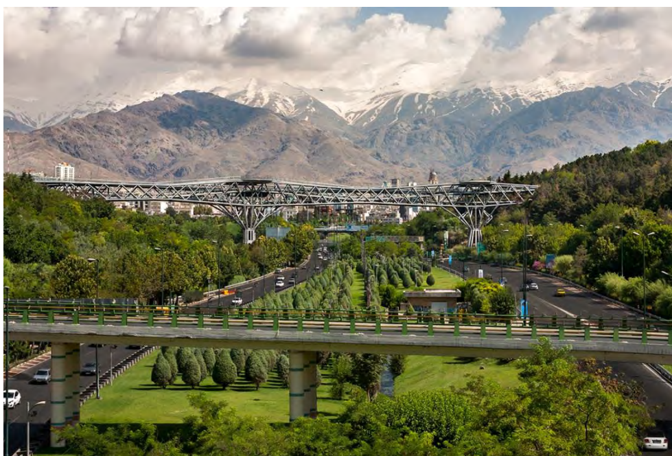
Рисунок 1 – Табиатский пешеходный мост

Табиатский пешеходный мост расположен в столице Ирана Тегеран. Построен данный мост в октябре 2014 года. Длина моста составляет порядка 270 м, а площадь – 46000 м 2 . Данный мост был построен с целью соединения двух парков Або Аташ на западе с парком Телегани на востоке, разделенных шоссе Модаррес на севере Тегерана, в районе Аббас-Абад, при этом не загромождая вид на горы Альборз. (Рис. 1).