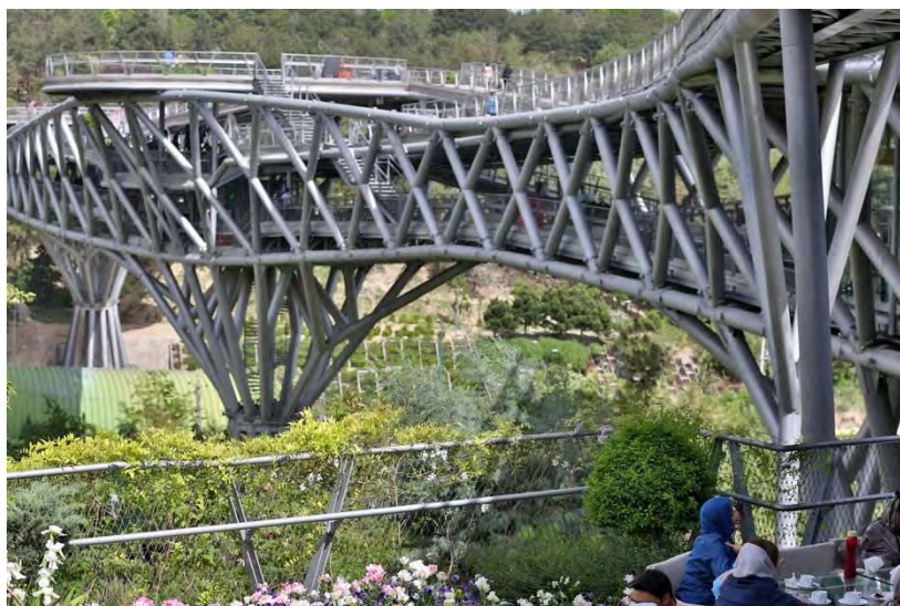
Рисунок 2 – Опоры моста

Данная конструкция служит не только в качестве перехода. На самом мосту расположены такие объекты как кофейня, ресторан, киоски, зеленые насаждения и места для сидения. (Рис. 3). Такие решения позволяют людям задержаться на мосту, насладиться видом и отдохнуть. Придумано это для того, чтобы люди не могли понять, где начинается мост, а где парк, то есть мост является продолжением парка.