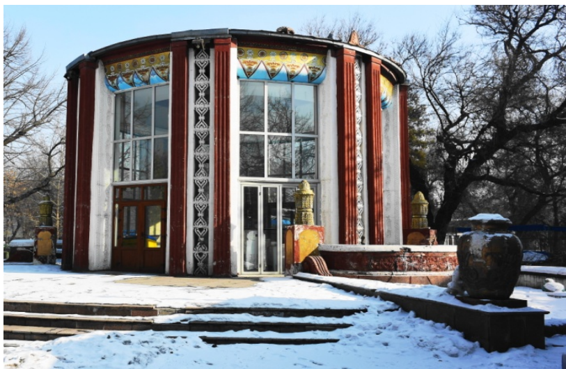
Рис. 2. Павильон «Соки-воды». Арх. А.М. Альбанский. 1952 г.

Несмотря на то, что поиски национальной идентичности в настоящее время не являются магистральным направлением развития архитектуры Кыргызстана, многие молодые архитекторы успешно работают в этом направлении [4].