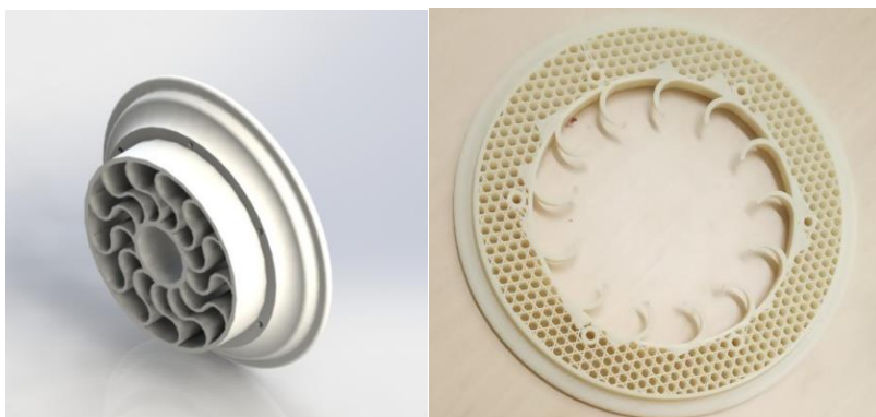
Рисунок 2 – Модель обод колеса и внутренняя структура колеса