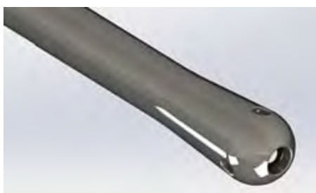
Рис. 2. Сферический наконечник трубчатого концентратора-волновода

В сферическом наконечнике имеются осевое ( (0,50 \pm 0,05) мм) и боковые ( (0,30 \pm 0,05) мм) микроотверстия, предназначенные для воздействия образующейся кавитационной струей как на внутрисосудистое образование, так и на пораженный участок сосудистой стенки, что позволяет восстанавливать проходимость сосуда с одновременным повышением эластичности сосудистой стенки (рис. 2) [5]. Трубчатые концентраторы-волноводы медицинского назначения могут быть изготовлены из коррозионно-стойкой стали (типа 12X18H10, или могут быть использованы ее аналоги).