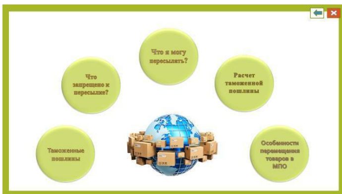
Рис. 2. Международные посылки

При выборе международных посылок произойдет переход на страницу, где нужно выбрать интересующий раздел: