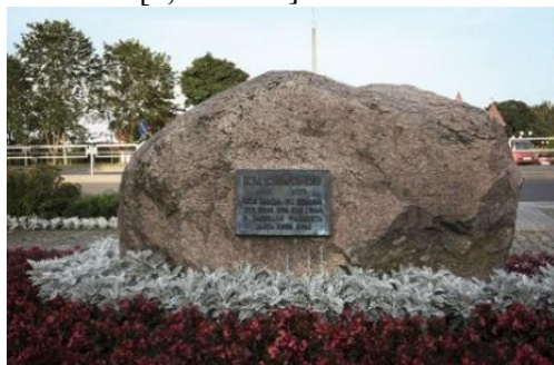
Камень на Буйническом поле

Писатель так проникся чувством любви к своей Родине, забываемым впечатлением об этом сражении, что завещал развеять свой прах на том самом Буйническом поле, и его желание было исполнено в июле 1979-го года. Память о великом патриоте своей страны, писателе и поэте навсегда увековечена в камне на Буйническом поле [3, С.13-16].