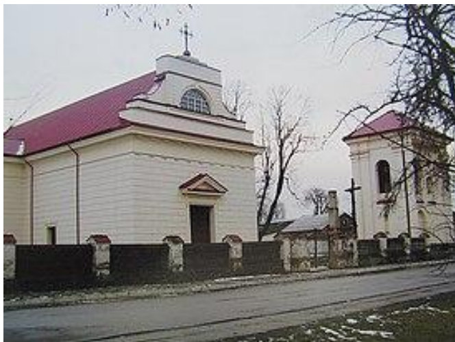
Костёл Святой Троицы

костеле Наисвятейшей Троицы в Росси находится чудотворная скульптура Христа Скорбящего, а также великолепный саркофаг Софьи Пац. Первый деревянный костел в Росси появился в конце XVI века благодаря инициативе канцлера ВКЛ.