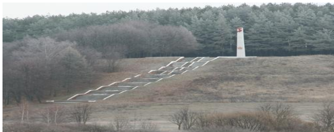
Памятны знак «Стэла»

За перыяд акупацыі фашысты амаль знішчылі горад Шклоў, разбурылі чыгуначную станцыю, мост праз раку Днепр, спалілі цалкам 18 і часткова 108 вёсак Шклоўскага раёна. Больш за 2000 чалавек сагнана на прымусовую працу, столькі ж чалавек расстраляна, спалена, павешана. У адпаведнасці з перапісам насельніцтва 1939 года ў Шклове пражывала 2132 габрэяў, якія складалі 26,7% ад агульнай колькасці жыхароў. Усіх габрэяў горада, якія не паспелі эвакуіравацца, нацысты сагналі ў шклоўскае гета і ў хуткім часе практычна ўсіх знішчылі [2, С. 328]. У нішах памятнага знака «Стэла» захоўваюцца капсулы з зямлёй вёсак, спаленых у гады Вялікай Айчыннай вайны