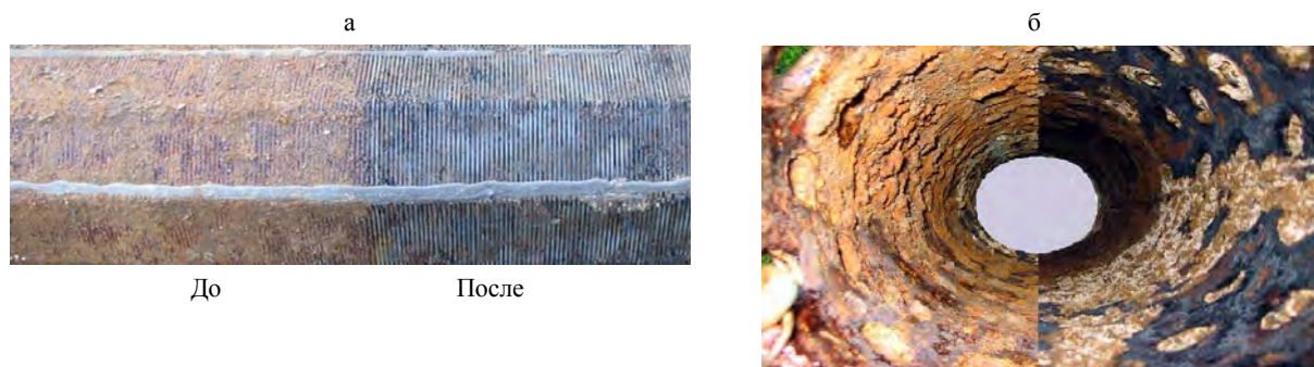
Рис. 3. Фрагмент: а – внешней части фильтра до и после проведения декольматации; б – внутренней

На рис. 3 представлен фрагмент внутренней и внешней частей фильтра до и после проведения регенерации.