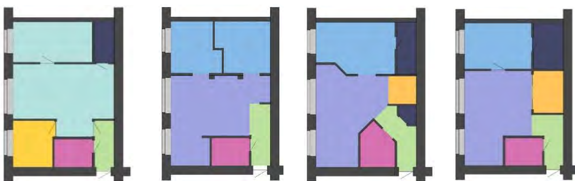
Рис.4. Существующая планировка и варианты перепланировки двухкомнатной квартиры