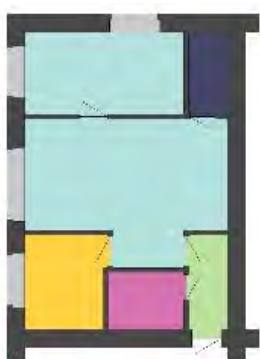
Рис.5. Существующая планировка и варианты перепланировки двухкомнатной квартиры