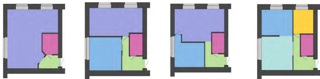
Рис. 3. Существующая планировка и варианты перепланировки однокомнатной квартиры