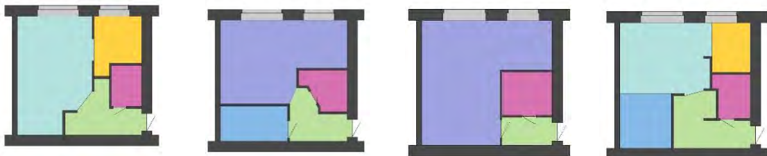
Рис. 2. Существующая планировка и варианты перепланировки однокомнатной квартиры