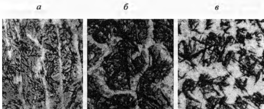
Рис. 2. Микроструктура наплавленного слоя из стружки, подверженной ХТО: а – цементация 910 °С; б – нитроцементация 860 °С; в – нитроцементация 760 °С, \times 1000

ных после наплавки нитроцементированных отходов быстрорежущей стали, представлена на рис. 2, б. Наплавленные слои после нитроцементации представляют собой светлую сетку с включениями карбонитридов розового цвета и дендритов, состоящих из мартенсита и аустенита остаточного и мелкодисперсных округлых карбидов. Количество аустенита остаточного составляет 5–10 %. С понижением температуры нитроцементации до 760 °С в структуре наплавленного слоя резко увеличивается количество остаточного аустенита до 50–60 % (светлое поле), в котором имеются включения карбонитридов розового цвета и иглы мартенсита (рис. 2, в).