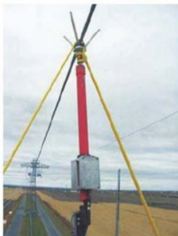
Рис. 7. Передвижное устройство для механического удаления гололеда провода

Сегодня робот LineScout может перемещаться по работающим линиям электропередач и давать информацию о состоянии линий. Специалисты управляют роботом дистанционно, находясь на земле, и таким образом они могут обнаружить повреждение, удалить лед с проводов и выполнить простой ремонт. А такой формат работы позволяет получить значительную экономию, так как для осмотра не нужно обесточивать линию электропередач, а также позволяет снижать риски, повышать безаварийность работы и безопасность работы людей.