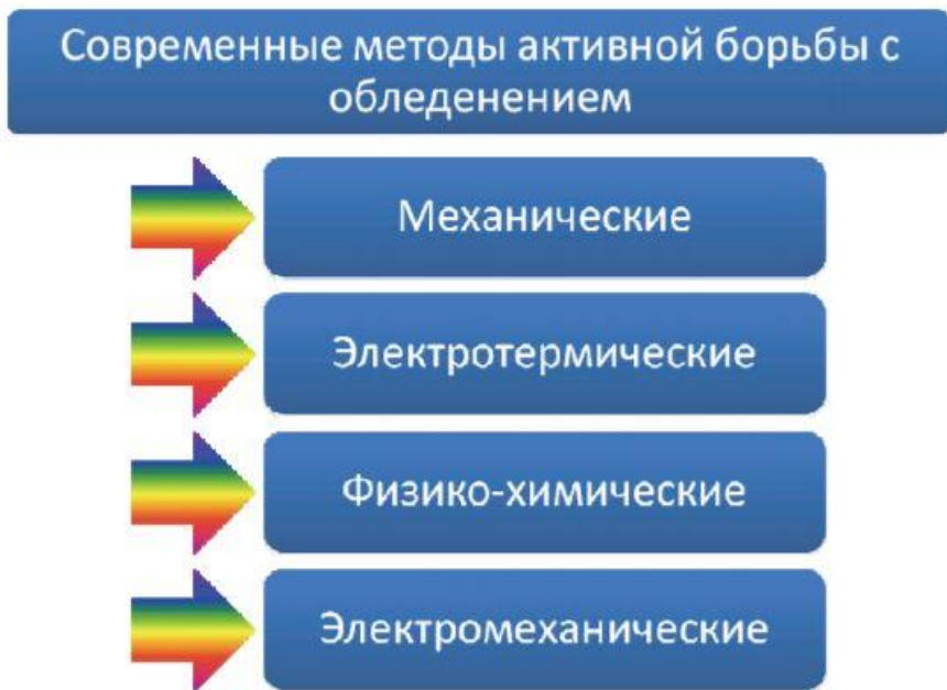
Рис. 4. Современные методы активной борьбы с обледенением