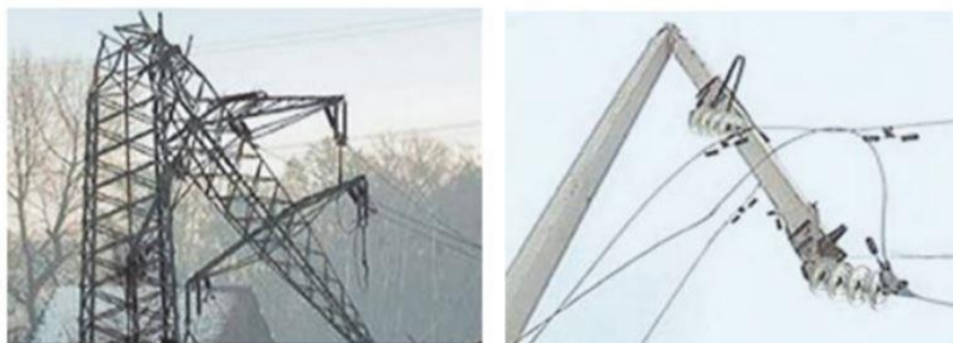
Рис. 3. Гололёд – бедствие для линий электропередач

При значительных гололедных отложениях возможны обрывы проводов, тросов, разрушения арматуры, изоляторов и даже опор воздушных линий (рис. 3).