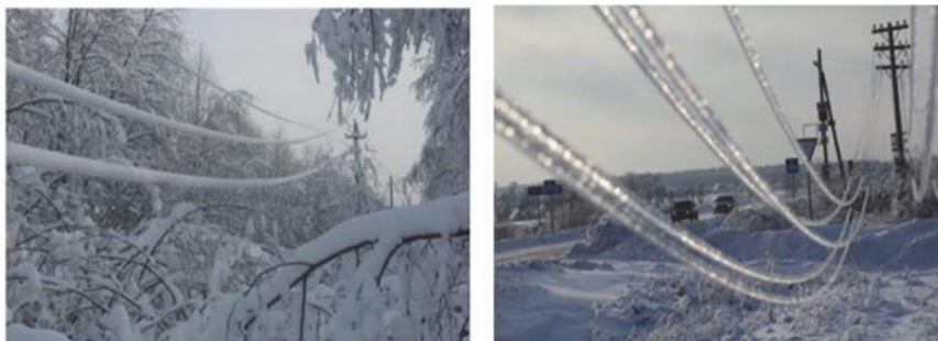
Рис. 1. Гололедные отложения на проводах воздушной линии электропередач