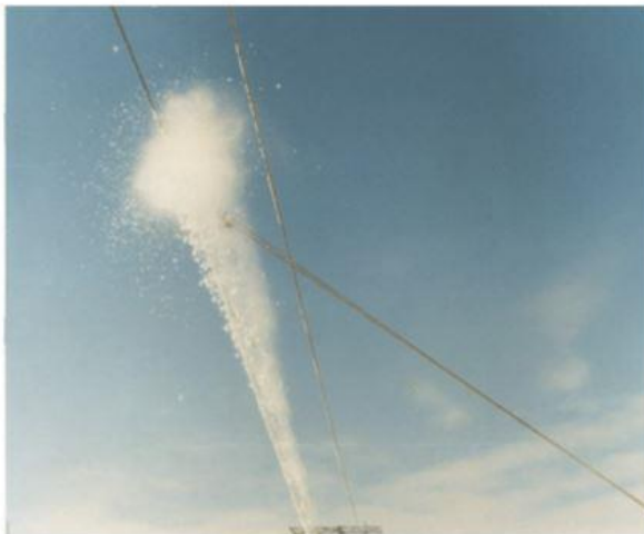
Рис. 6. Пневматическое устройство для механического удаления льда с провода

Другое усовершенствованное приспособление было также разработано в Канаде (рис. 7) и представляет собой передвижное устройство, управляемое с земли. Оно является электроимпульсным и за достаточно короткий промежуток времени позволяет освободить от гололеда провод в пролете длиной 260 м.