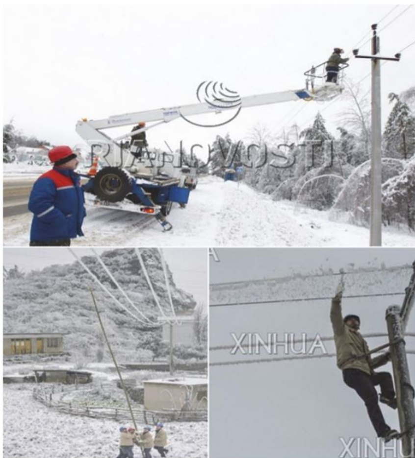
Рис. 5. Механическое удаление отложения льда с проводов

Удаление гололеда с проводов шестами практически неосуществимо без привлечения большого количества рабочих. Этот метод требует много времени и применяется только на коротких участках линий, когда плавка электрическим током экономически нецелесообразна или технически невыполнима.