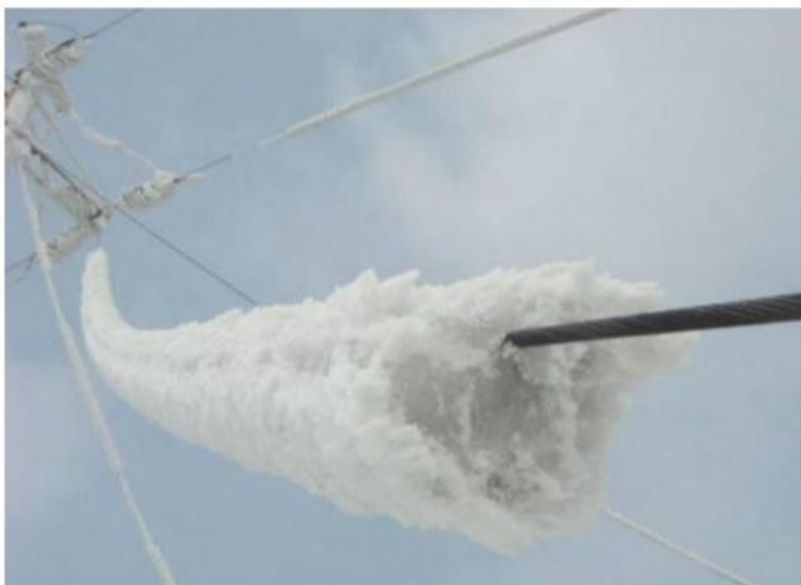
Рис. 2. Характерное обледенение провода ЛЭП