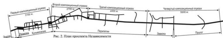
Рис. 2. План проспекта Независимости