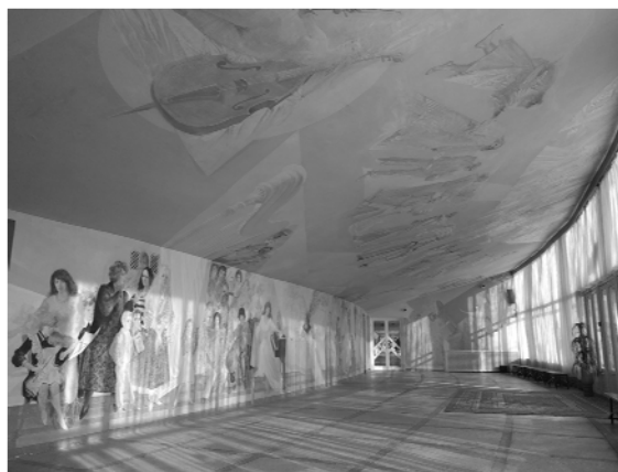
Рис. 6. Роспись в фойе актового зала ГУО «Гимназии-колледжа искусств им. И.О. Ахремчика».

дения монументально-декоративного искусства относительно помещения.