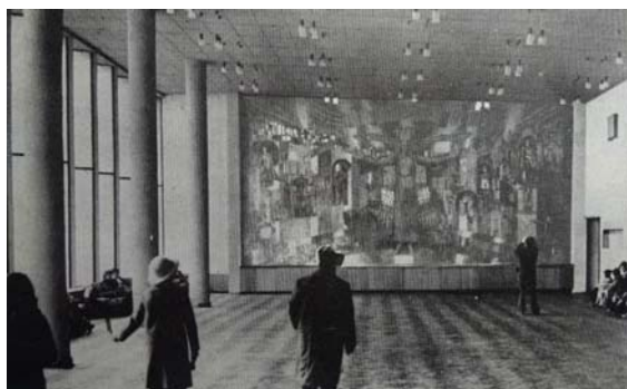
Рис. 1 Роспись фойе столичного кинотеатра «Вильнюс», авт. С. Каткова, З. Литвинова

Визуальная ось, подчёркнутая оконными проемами и светильниками, женская фигура с разведенными руками, находящаяся в центре живописной композиции, поддерживают диагонали, зрительно меняют пропорции внутреннего пространства. Насыщенные темные цвета также зрительно меняют пропорции. В результате, активный декоративный элемент, который любой посетитель кинотеатра рассмотрел в ожидании киносеанса, приносил не только эстетическое удовольствие, но и обогащал новыми знаниями и образами, воспитывал, учил, пробуждал дух патриотизма (рис. 1, 2).