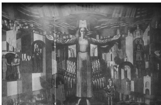
Рис. 2 Роспись фойе столичного кинотеатра «Вильнюс», авт. С. Каткова, З. Литвинова

В качестве примера системы элементов монументально-декоративного искусства, «вписанных» в интерьер, можно привести решение интерьера ГУО «Гимназии-колледжа искусств им. И.О. Ахремчика».