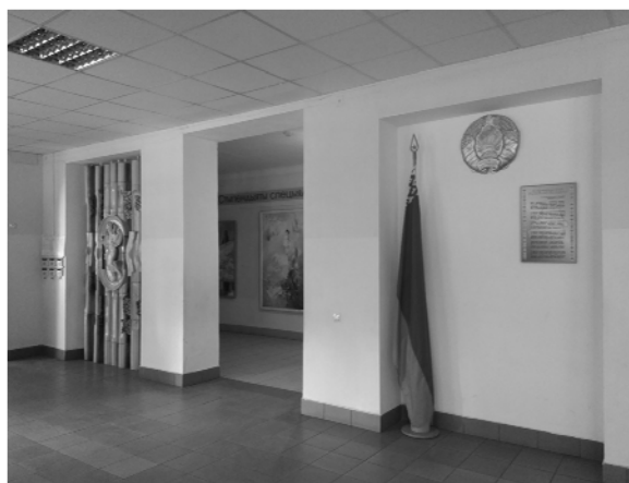
Рис. 4. Интерьер ГУО «Гимназии-колледжа искусств им. И.О. Ахремчика». Вестибюль

Уникальная светоцветовая среда интерьера создается с помощью витражей (литое стекло) в лестничных пролетах, росписи в столовой, сменных экспозиций живописи,