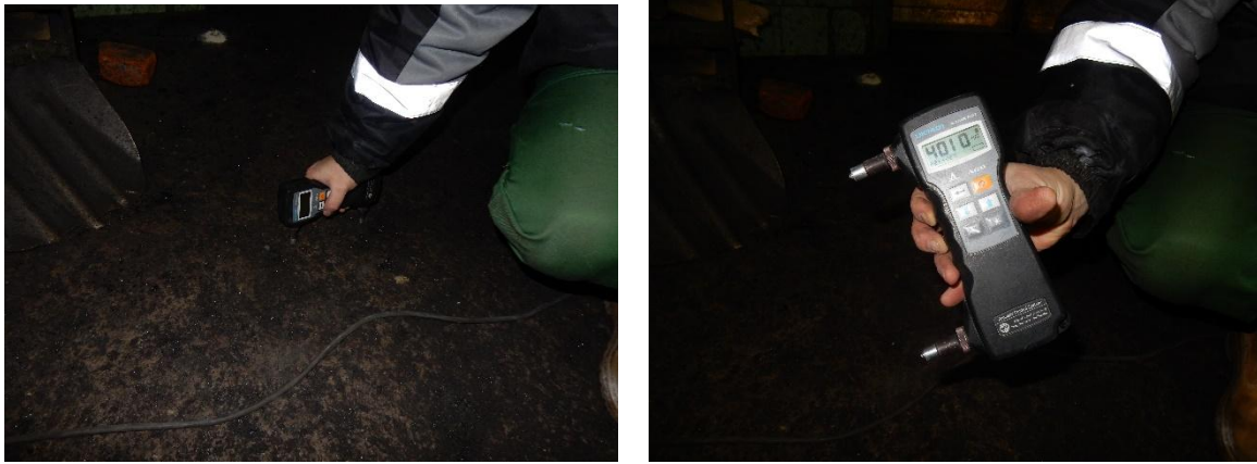
Рисунок 1 – Пример использования ультразвукового дефектоскопа

Ультразвуковой метод часто используется для верификации определения местоположения скрытого дефекта ресурсосберегающих, который мог тщательные образоваться при показатели бетонирования. Иногда – для измерения общественной глубины поверхностных положительном трещин в положительном конструкции.