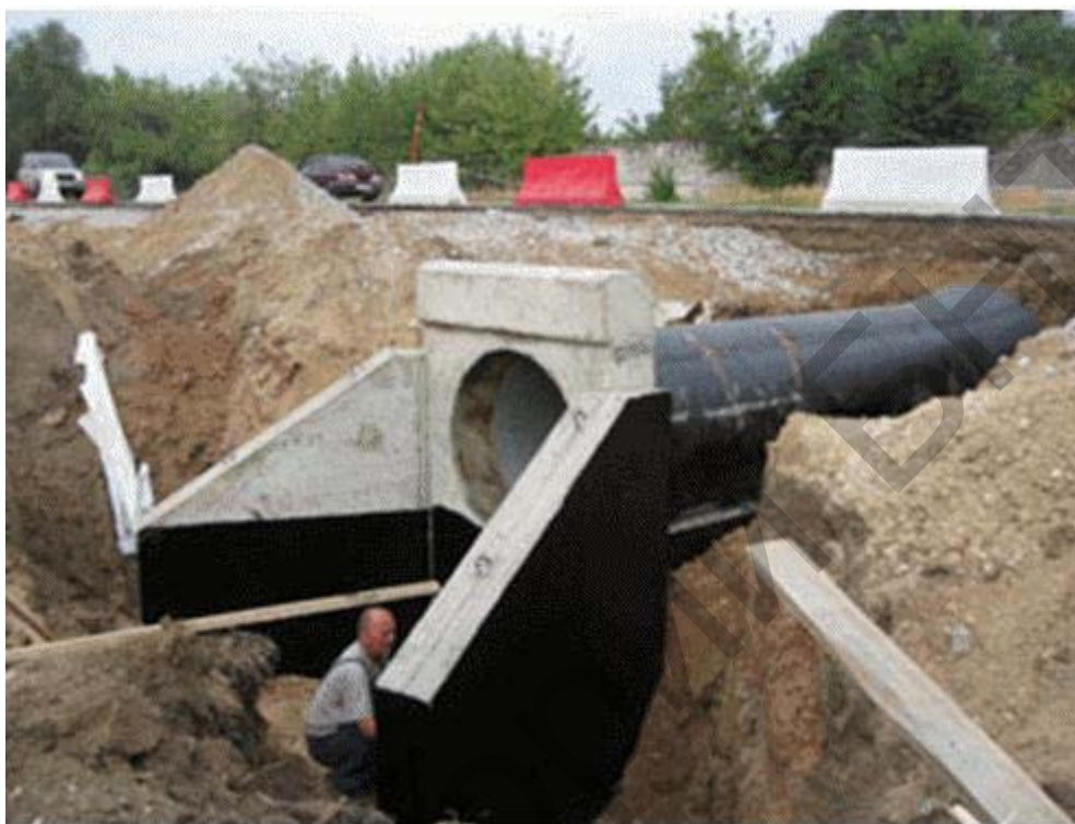
Рисунок 2 – Пример нанесения битумной мастики

При наружной подготовке конструкции требуется очищение от грязи, просушка, грубо говоря, нужно подготовить конструкцию к нанесению битумной мастики.