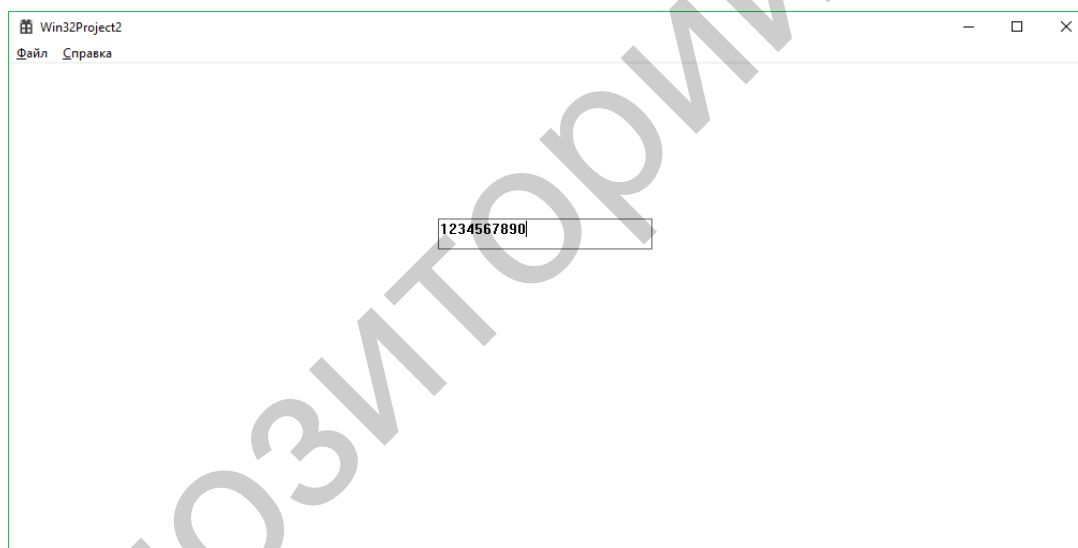
Рисунок 2. Разработанный пользовательский элемент управления Edit.

Разработанный пользовательский элемент управления Edit может быть использован для регулирования ввода информации. Возможно усовершенствование также других элементов управления, что может способствовать улучшению качества разрабатываемых приложений при их использовании, а также делать работы пользователя более удобной, простой и комфортной.