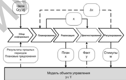
Рисунок 2 – Модель цикла менеджмента

При использовании количественных показателей цикл менеджмента приобретает количественную детализацию [1], приведенную на рис. 2. При рассмотрении задач менеджмента важным является выделение в процессах деятельности роли менеджмента и экономического объекта и их ответственности за реализацию отдельных компонент деятельности.