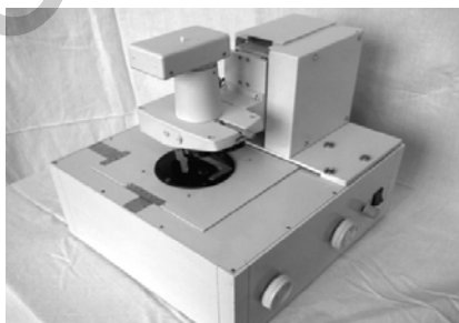
Рисунок 2 - Двухкоординатный компьютеризированный сканер комплекса

Программно – математическое обеспечение комплексов имеет русскоязычный интерфейс и обеспечивает выполнение следующих функций: