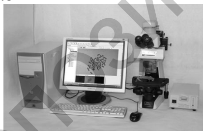
Рисунок 1 – Аппаратная конфигурация комплекса с микроскопом

Разработанные компьютерные комплексы представляют собой многофункциональную программно – аппаратную платформу для автоматизированного анализа различных изображений с использованием микроскопов, рисунок 1 и компьютерных двухкоординатных сканеров, рисунок 2 для оцифровки и обработки различных снимков и изображений материальных структур на пленках, стеклах и чипах.