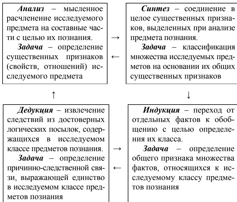
Рис. 1. Схема взаимосвязей между основными логическими приемами мышления

индукция (лат. inductio – наведение) и дедукция (лат. deductio – выведение). Рассмотрим взаимосвязи между этими приемами (рис. 1).