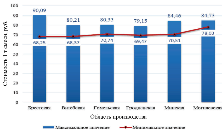
Рис. 1. Результаты мониторинга стоимости асфальтобетонной смеси (март 2017 г.)

Для снижения удельного веса затрат на материальные ресурсы в составе сметной стоимости строительства автомобильных дорог требуется учет многих критериев, определяемых отраслевой особенностью организации выполняемых видов работ.