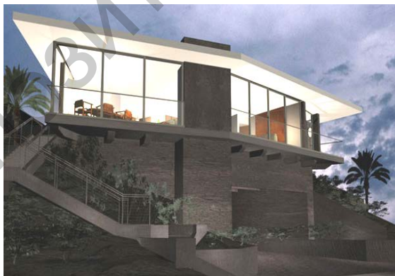
Рисунок 1 – Экодом в городе Манчестер в штате Нью Гэмпшира (США)

Развитие энергоэффективных построек восходит к исторической культуре северных народов. Примером техники повышения энергоэффективности дома является русская печь, отличающаяся толстыми стенками, хорошо сохраняющими тепло, и оснащенная дымоходом со сложной конструкцией лабиринтов. К современным экспериментам повышения энергоэффективности зданий можно отнести сооружение, построенное в 1972 году в городе Манчестер в штате Нью Гэмпшир (США) (рисунок 1). В 1973–1979 годах был построен комплекс «Econo-House» в городе Отаниеми, Финляндия.