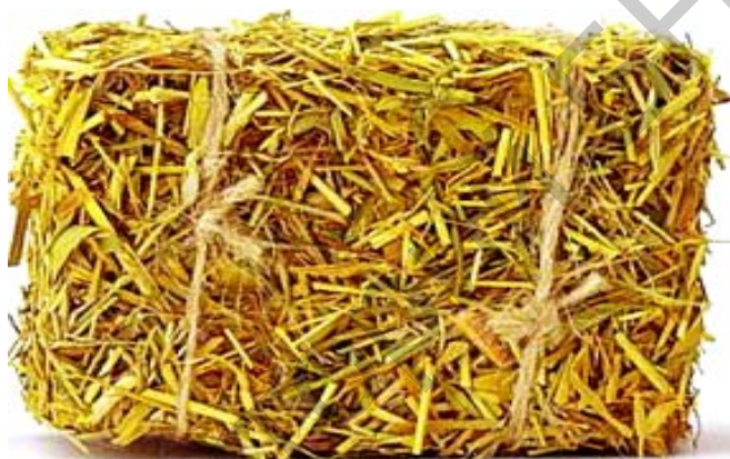
Рисунок 2 – Соломенный блок

Материалы, из которых строятся энергопассивные дома в наше время, должны быть доступными и экологически чистыми. При их применении должны учитываться энергоемкость, экологичность и жизненный цикл. Как раз всем перечисленным характеристикам и отвечает прессованная солома (рисунок 2).