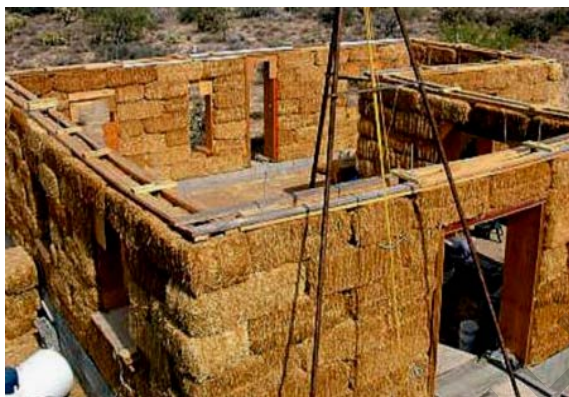
Рисунок 3 – процесс возведения дома из соломенных блоков