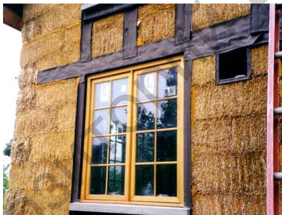
Рисунок 4 – соломенный экодом. Отделка фасада

Солома прессуется пресс-подборщиками или вручную на специальных прессах. Спрессованный блок перевязывается металлической проволокой, или нейлоновым шнуром. Размер блоков в среднем составляет 90 см в длину, 45 см в ширину и 35 см в высоту. Вес блока около 23 кг. Средняя плотность 80–150 кг/м 3 . Обычно используется солома ржи, льна или пшеницы, возможно также использование сена.