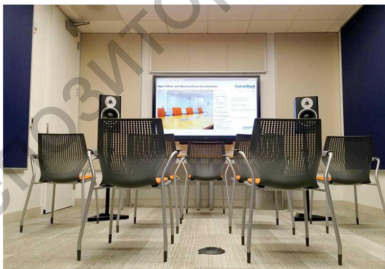
Рисунок 2 – Инновационные средства озвучивания, такие как этот полигон для акустического проектирования, могут помочь профессионалам определить, как соответствовать требуемым рейтингам STC и IIC для своих проектов

Один из способов, с помощью которого архитекторы и дизайнеры могут тестировать акустику в коммерческих помещениях, таких как офисы - это использовать новые средства аурализации. Так же, как эскизы и 3D-визуализация используются для визуализации эстетики незастроенного проекта, новые инструменты могут помочь дизайнерам спецификаций с учетом акустического моделирования.