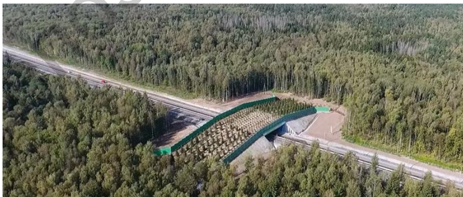
Рысунак 1 – Мост у Калужскай вобласці

Напрыклад, мост Калужскай вобласці складае ў шырыню 52 метры і валодае гукаізаляцыяй, каб лісы і кабаны, перасякаючы трасу М3, не спалохаліся гукаў, якія выдаюцца аўтамабілямі. Таксама на мосте высаджана трава вышынёй 80 сантыметраў і ёсць дрэвы. Сама ж траса на працягу некалькіх кіламетраў ад моста ў абодва бакі абгароджана спецыяльнымі плотам - каб жывёлы не выходзілі на трасу, а карысталіся мостам. Такія аб'екты заўсёды ўзводзяцца сумесна з міністэрствам Прыроды і міністэрствам транспарту.