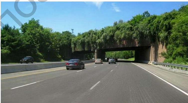
Рисунак 7 – адзін з пераходаў у індзейскай рэзервацыі, штат Мантана