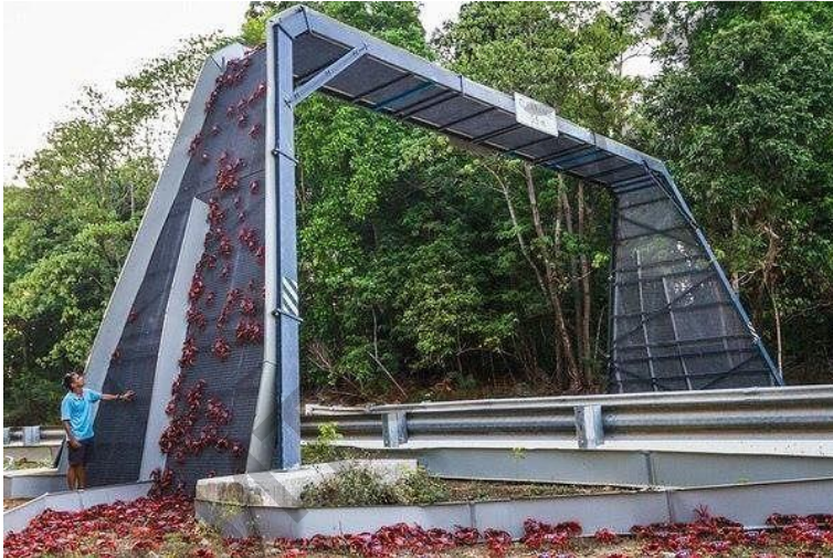
Рысунак 2 – Экадук востраве Каляд

Унікальнае прыроднае з'ява можна назіраць на аўстралійскім востраве Каляд. Штогод у лістападзе ці снежні мільёны чырвоных крабаў мігруюць з трапічных лясоў, размешчаных у цэнтральнай частцы гэтага невялікага кавалачка сушы, на ўзбярэжжы Індыйскага акіяна для размнажэння. Пачатак перамяшчэння залежыць ад умоў надвор'я - змены фазы месяца і дажджоў. Крабам жыццёва неабходная вільгаць, і міграцыя пачынаецца з прыходам першых ліўняў. Асфальтавыя дарогі, тратуары, тунэлі, сцяжынкі і акіянскае ўзбярэжжа на некалькі тыдняў становяцца падобныя на жывыя хвалі. Працэс у сярэднім займае 18 дзён. Жывёлы, колькасць якіх дасягае 120 мільёнаў асобін, ствараюць падабенства чырвонай дывановай дарожкі і маюць прыярытэт: для ракападобных перакрываюць трасы і будуюць часовыя масты, дазваляючы дабрацца да ўзбярэжжа з мінімальнымі стратамі.