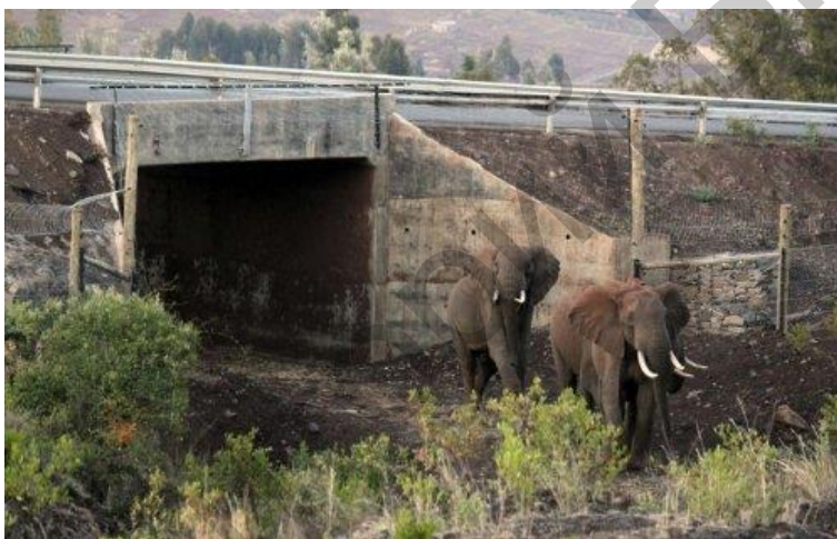
Рисунак 12 – Пераход для сланоў у Кеніі