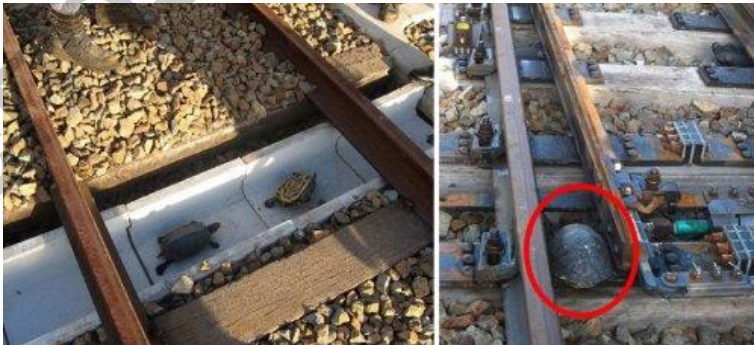
Рисунок 10 – Тунэль для чарапах ў Японіі