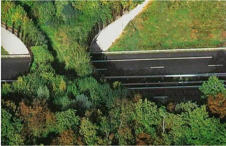
Рисунак 5 – «Мост живой природы» у Францыі