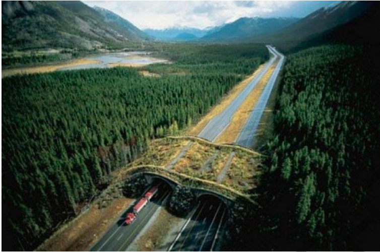
Рысунак 3 – Мост ў канадскім Нацыянальным парку Банф

У ЗША за апошнія 30 гадоў пабудавалі некалькі сотняў экадукаў: для абароны пантэр ў Фларыдзе, плямістых саламандры ў Масачусецы, снежных коз ў Мантане, авечак-таўстарогаў у Каларада і пустынных чарапах ў Каліфорніі.