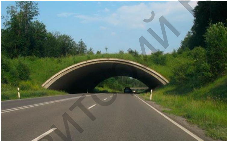
Рисунак 6 – Böblingen, Германія