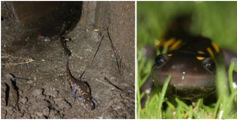
Рисунок 8 – Тунелі для саламандр, Новая Англія, ЗША