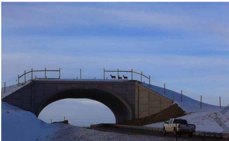
Рисунак 11 – Экадук ў Каларада