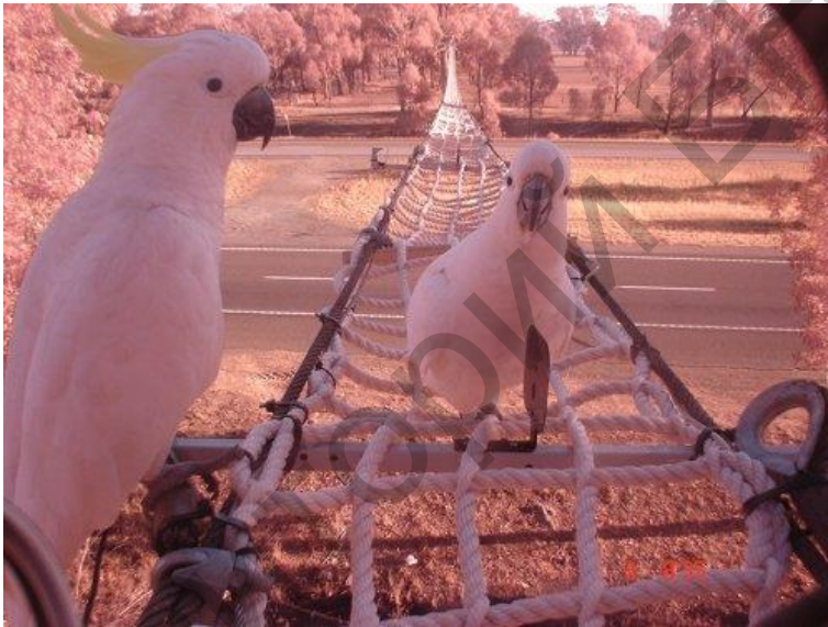
Рисунок 9 – Вераўчаны мост над шашой у штаце Вікторыя