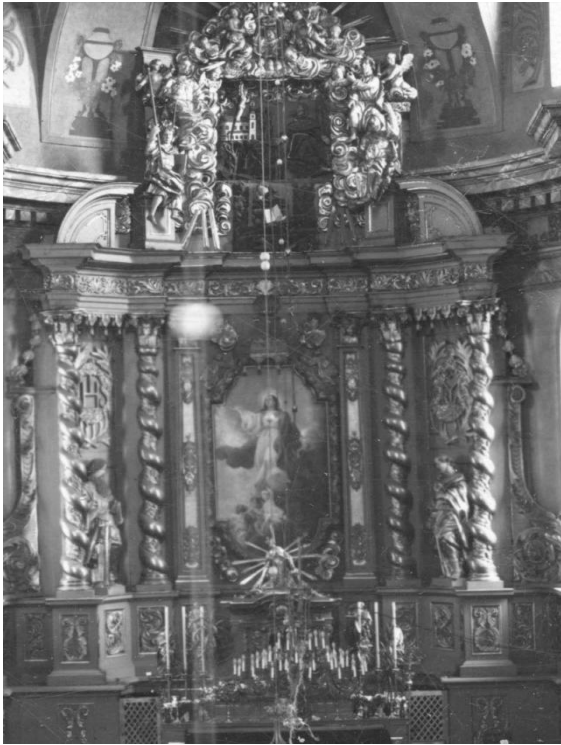
Рис. 9. Главный алтарь костела францисканцев в Пинске

Такою идею представил Johann Jacob Schübler [14]. В своем эстампе он закомпонировал алтарную наставу таким образом, чтобы она логично объединила две противоположные стены нефа.