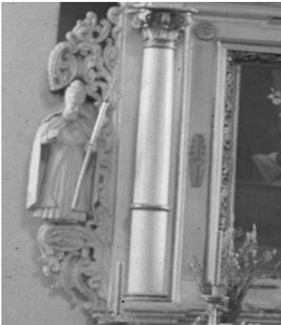
Рис. 2. Фрагмент бокового алтаря (Свирь)

Влияние фламандских образцов на формирование архитектуры алтарей прослеживается на всем протяжении XVII в., вплоть до начала XVIII в. Это явление видно не только на способе изготовления отдельных декоративных элементов, но и на общем композиционном замысле.