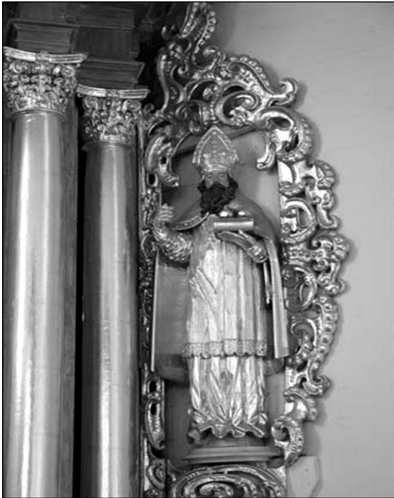
Рис. 1. Фрагмент бокового алтаря (Волпа)