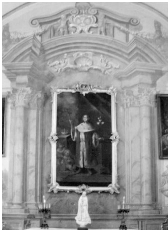
Рис. 7. Алтарь в каплице костела в Ружанах