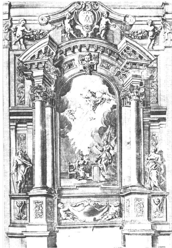
Рис. 6. Рисунок из трактата Pozzo, Andrea Perspectiva pictorum et architectorum...

Начиная с первой четверти XVIII в. австрийские и южно-немецкие образцы-эстампы представляли собой различные вариации главных и боковых алтарей, исполненных в стиле рококо.