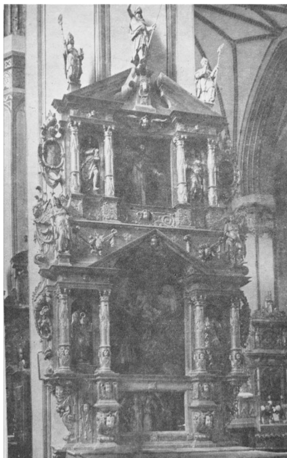
Рис. 5. Боковой алтарь. Frombork (Польша)

Многочисленные примеры такого рода настав, отличающихся лишь декоративным оформлением, можно видеть на примерах главных алтарей костелов в Волпе, Комаях, Одельске, Лиолияе (Lioliai, Литва), Линкуве (Linkuva, Литва), Лаукжеме (Laukžeme, Литва), Данкуве (Danków, Польша) и прежде всего в алтарной наставе, изготовленной для знакового объекта – чудотворной иконы Божьей Матери ченстоховской.