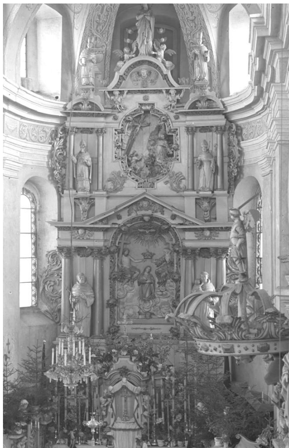
Рис. 4. Главный алтарь в францисканском костеле в Гродно

Такие примеры можно видеть в алтарной наставе главного алтаря костела францисканцев в Гродно (рис. 4) и боковом алтаре костела во Фромборке (Frombork, Польша) (рис. 5).