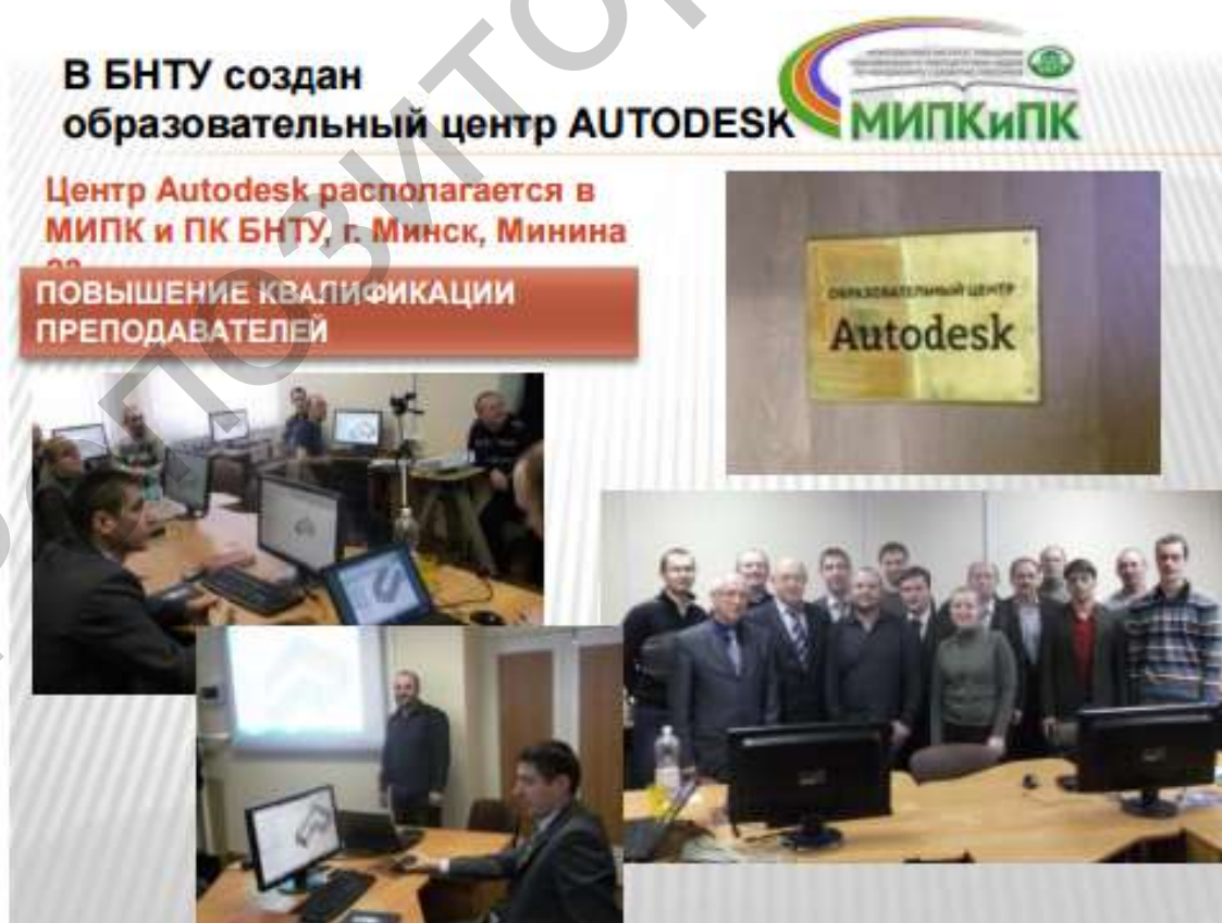
Рисунок 1 –Повышение квалификации преподавателей

Не так давно стремительно начала развиваться такая технология, как ВІМ. В Беларуси серьезно подошли по развитию ВІМ на государственном уровне. В сфере освоения программ, разработке и вводе информационных методик, была создана научная программа по специальностям «Архитектура», «ПГС», «Мосты и тоннели». Беларуский национальный технический университет перешел на обучение кадров для освоения технологии моделирования зданий. Ведущий технический вуз стал еще одним пользователем программного обеспечения Autodesk, получив бесплатное использование всех продуктов. Это обучение включает в себя подготовку и переподготовку специалистов (Рис. 1).