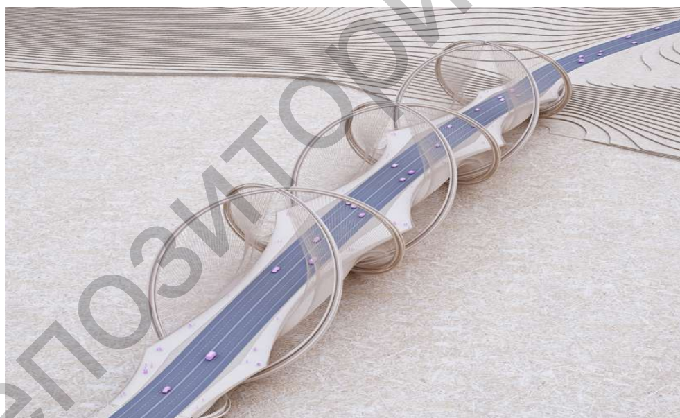
Рисунок 1 – Проект моста Сан-Шань

Разрабатывая конструкцию моста, архитекторы вдохновлялись эмблемой Игр – олимпийскими кольцами. (Рис. 1).