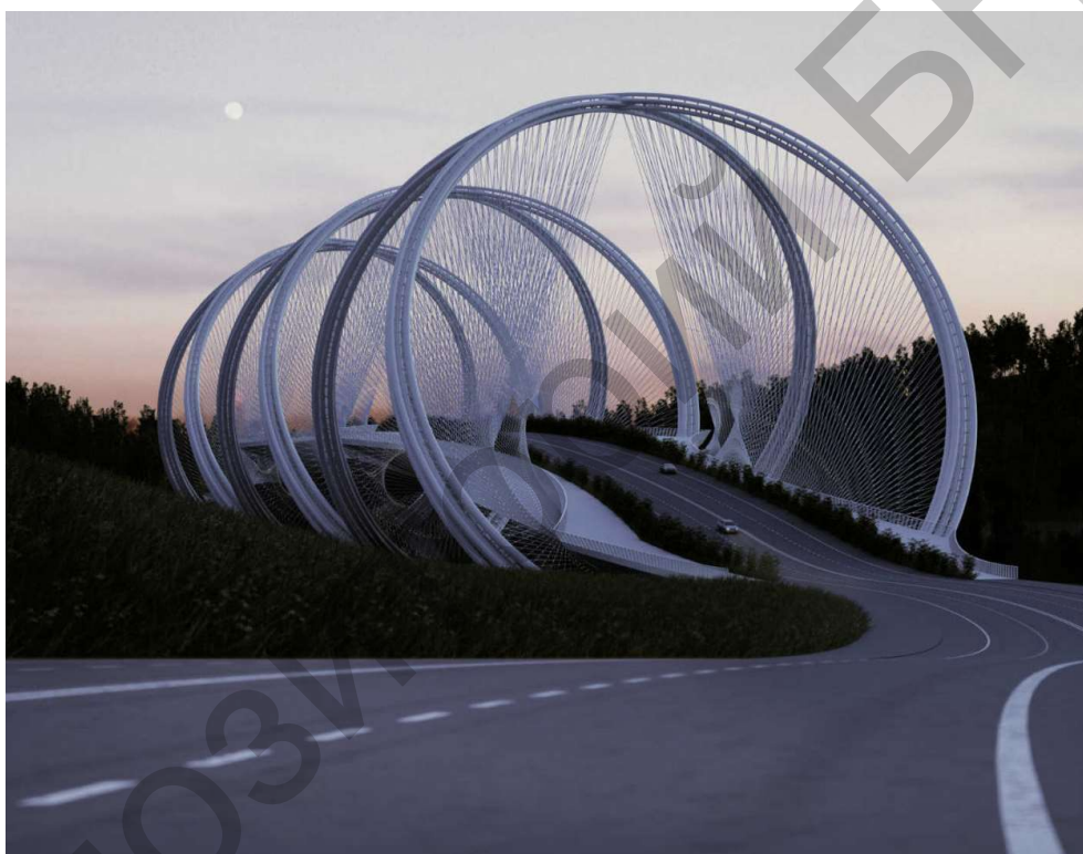
Рисунок 2 – Смоделированный мост Сан-Шань

Структура моста Сан-Шань соединяет берега реки Гуй 452-метровой длиной моста и делится на три группы скрещивающихся стальных конструкций арочного типа с максимальным пролётом 95 метров. Последовательные дуги образуют предварительно напрядённые двойные спирали, которые пересекают и поддерживают друг друга в нижних и верхних частях. Спираль разработана и спроектирована так, чтобы она была тонкой насколько это возможно и предложить лучшие структурные характеристики. Проезжая часть моста подвешена с помощью высокопрочных стальных кабелей, которые подсоединены к аркам. (Рис. 2).