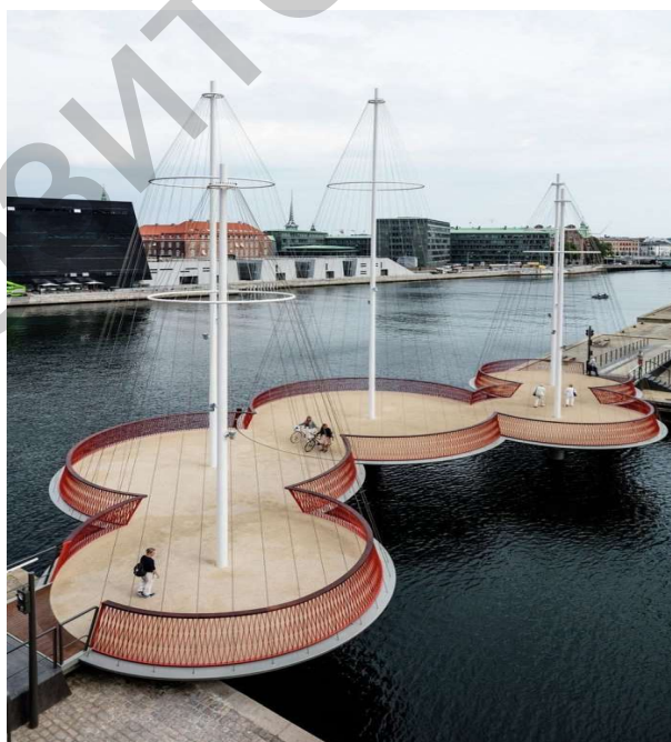
Рисунок 1. Круглые секции, имитирующие палубы корабля

Длина этого инженерного сооружения 40 метров, вес — 210 т, конструкция моста сделана в виде пяти секций (Рис. 1), которые имитируют парусные суда, ведь у каждой из них есть своеобразная мачта.