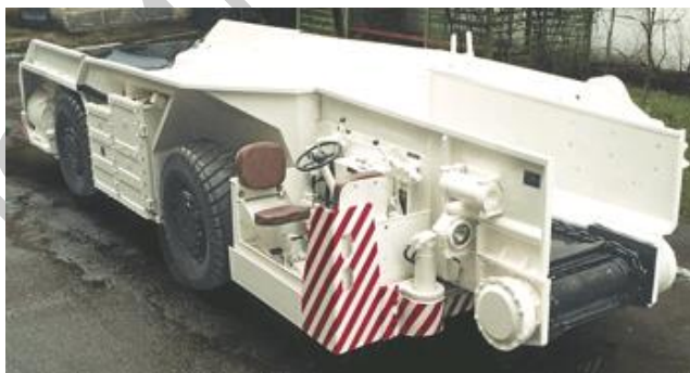
Рис. 1 – Самоходный шахтный вагон с донным конвейером

На калийных рудниках в зависимости от выполняемых операций при погрузке, доставке и разгрузке полезного ископаемого, используют разнообразные самоходные пневмоколесные машины, в особенности, такие как шахтные вагоны (ШВС) (рис. 1). В качестве загрузочных и разгрузочных механизмов в самоходном вагоне применяется двухцепной скребковый конвейер.