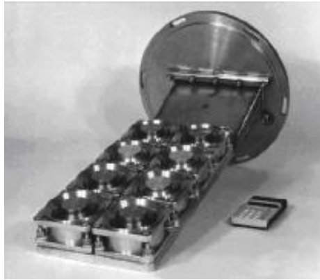
Рисунок 3 – Многокомпонентный электродуговой источник металлической плазмы