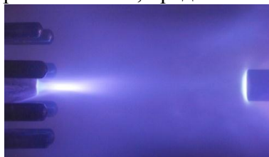
Рисунок 3 – Фотография процесса воздействия компрессионного плазменного потока на образец

экспериментах может изменяться от 2 до 8. Типичная фотография процесса воздействия компрессионного плазменного потока на образец, установленный на расстояние 16 см от среза разрядного устройства МПК, представлен на рисунке 3.