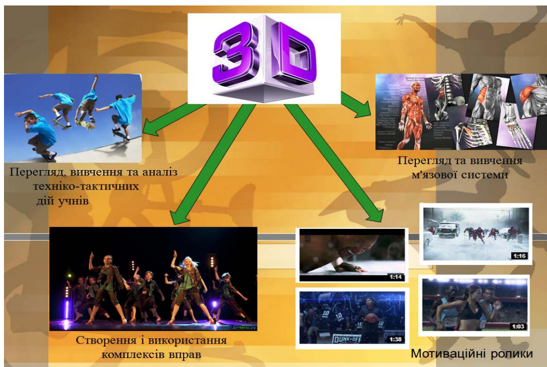
Рисунок 3 – Формы и дидактические возможности использования 3D-технологий в процессе физического воспитания учащихся

Для реализации этих возможностей мы используем поляризационные очки, закрепляя их на голове с помощью резиновой ленты. Их преимущество – это комфортность, безопасность и низкая стоимость (рисунок 4).