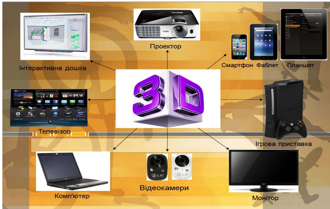
Рисунок 1 – Сочетание 3D-технологий с различными технологическими устройствами

чаще их использовать в качестве учебных технологий, которые формируют активную жизненную позицию («обучение на протяжении всей жизни»).