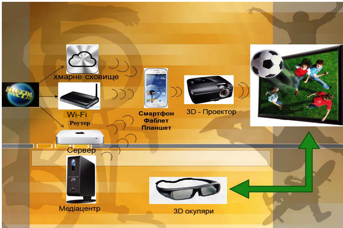
Рисунок 4 – Использование трехмерных изображений с помощью дистанционного Wi-Fi управления на уроках физической культуры

Однако наши наблюдения показали, что достаточно длительное использование поляризационных очков все же утомляет глаза и не столь комфортно при активных движениях. В связи с этим мы рекомендуем использовать растровые технологии – «паралексный барьер» и «лентичулярные линзы», что позволяет сделать просмотр трехмерного контента более привлекательным.