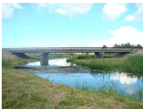
Рисунок 1 – Виды фасадов моста через реку Добысна

Напряженно-деформированное состояние конструкции (далее НДС) — совокупность внутренних напряжений и деформаций, возникающих при действии на неё внешних нагрузок, температурных полей и других факторов.