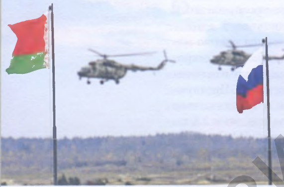
Комплексное оперативное учение Вооруженных Сил Беларуси «Осень-2008»

Вполне очевидно, что уже ряд лет Россия не имеет четкой стратегии развития отношений в рамках Союзного государства и со странами СНГ. Ее политика на данном направле-