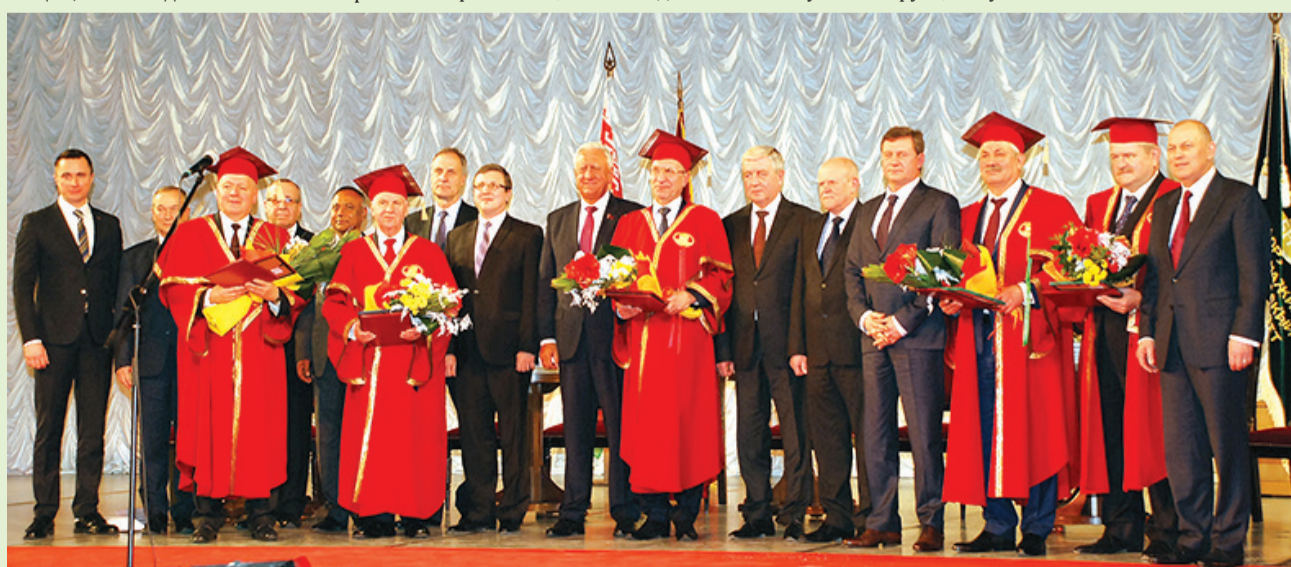
Почетные гости торжественного собрания коллектива Белорусского национального технического университета

Вице-президент Национального олимпийского комитета Республики Беларусь Николай Ананьев: «Беларусь гордится спортивными достижениями Политеха».