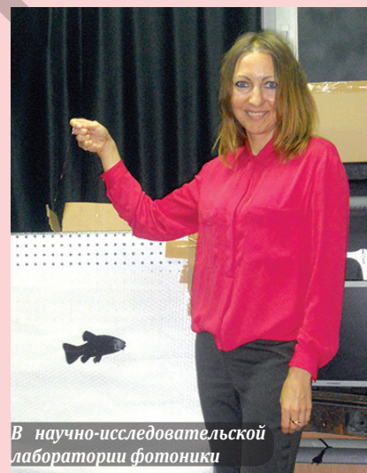
В научно-исследовательской лаборатории фотоники

Учитывая повсеместное распространение систем технического зрения для любительских и профессиональных целей, а также тенденцию снижения их стоимости и принимая во внимание чрезвычайное разнообразие технического и встроенного программного обеспеч-