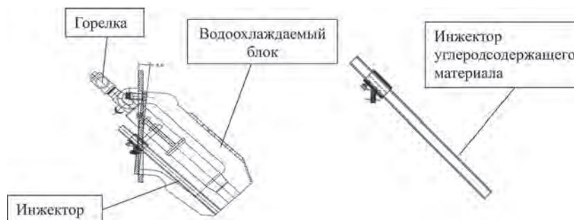
Рис. 2. Стеновой инжектор углерода