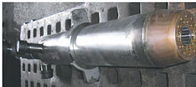
Рис. 1. Газокислородная когерентная горелка