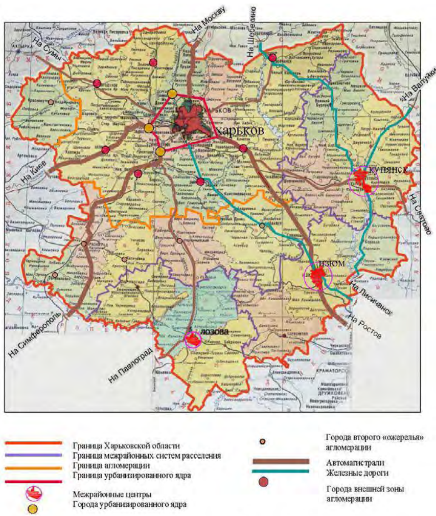
Рисунок 2 – Харьковская областная система расселения

есть необходимость создания на Юге области транспортных коридоров Западно-Восточного направления