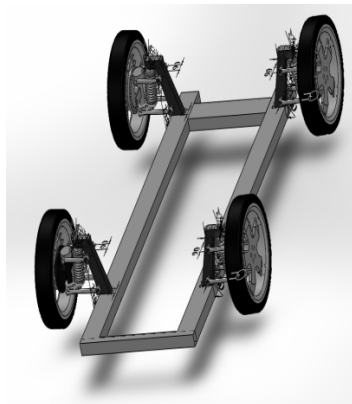
Рисунок 1: Модель рамы

Для проведения расчетов использовалась программа SolidWorks 2012. Результаты моделирования представлены на рисунках.