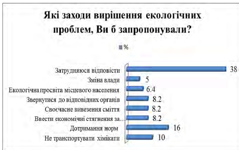
Рис. 2. Распределение респондентов по предложенным мерам решения экологических проблем

На вопрос, относительно мер по улучшению экологической обстановки в районе, большинство опрошенных (38%) затруднилось ответить.