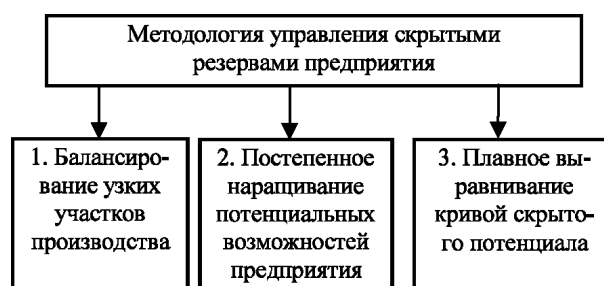
Рис. 3. Методология управления скрытыми резервами предприятия

Методология выявления скрытых резервов предприятия (рис. 3) заключается в комплексном, непрерывном и постепенном наращивании инновационного потенциала на всех стадиях его развития, что обеспечивает устойчивый рост.