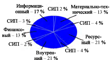
Рис. 2. СИП в общей структуре потенциала предприятия ОАО «Щучинский завод «Автопровод»»

В общей структуре инновационного потенциала предприятия СИП занимает очень малую долю (рис. 2). Он нигде не учитывается, и соответственно на него не выделяются средства и ресурсы.