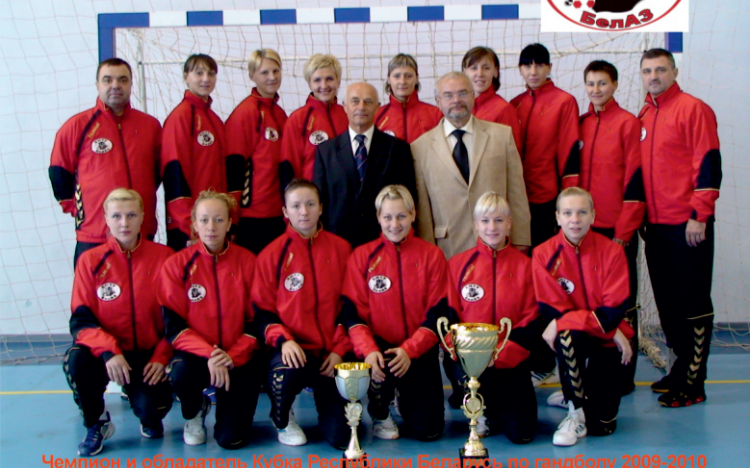
Чемпион и обладатель Кубка Республики Беларусь по гандболу 2009-2010