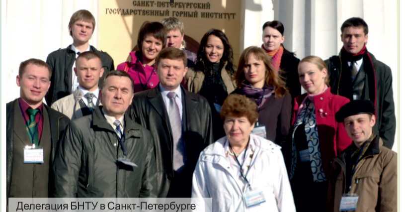
Делегация БНТУ в Санкт-Петербурге

В Санкт-Петербургском государственном горном институте (техническом университете) – первом высшем техническом учебном заведении России, основанном по Указу Петра I в 1773 году, состоялся VIII Международный форум-конкурс молодых ученых «Проблемы недропользования». В его работе участвовало около 400 молодых ученых из 67 университетов 17 стран мира, в том числе и БНТУ.