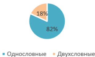
Рис. 2. Состав терминов

На рис. 2 показана диаграмма распределения терминов по составу. В английской терминологии архитектурных терминов, описывающих стиль барокко, основу составляют однословные термины (82 %). Двухсловные термины встречаются значительно реже (18 %).