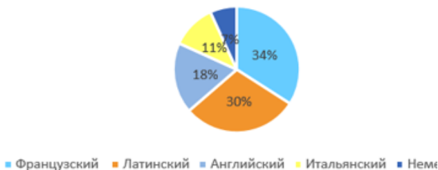
Рис. 1. Происхождение терминов

На рис. 1 представлена диаграмма, на которой показано происхождение терминов в исследованных текстах в процентном отношении к общему количеству терминов в текстах. В изученных текстах встречаются термины французского, английского, немецкого, латинского, итальянского, турецкого и арабского происхождения.