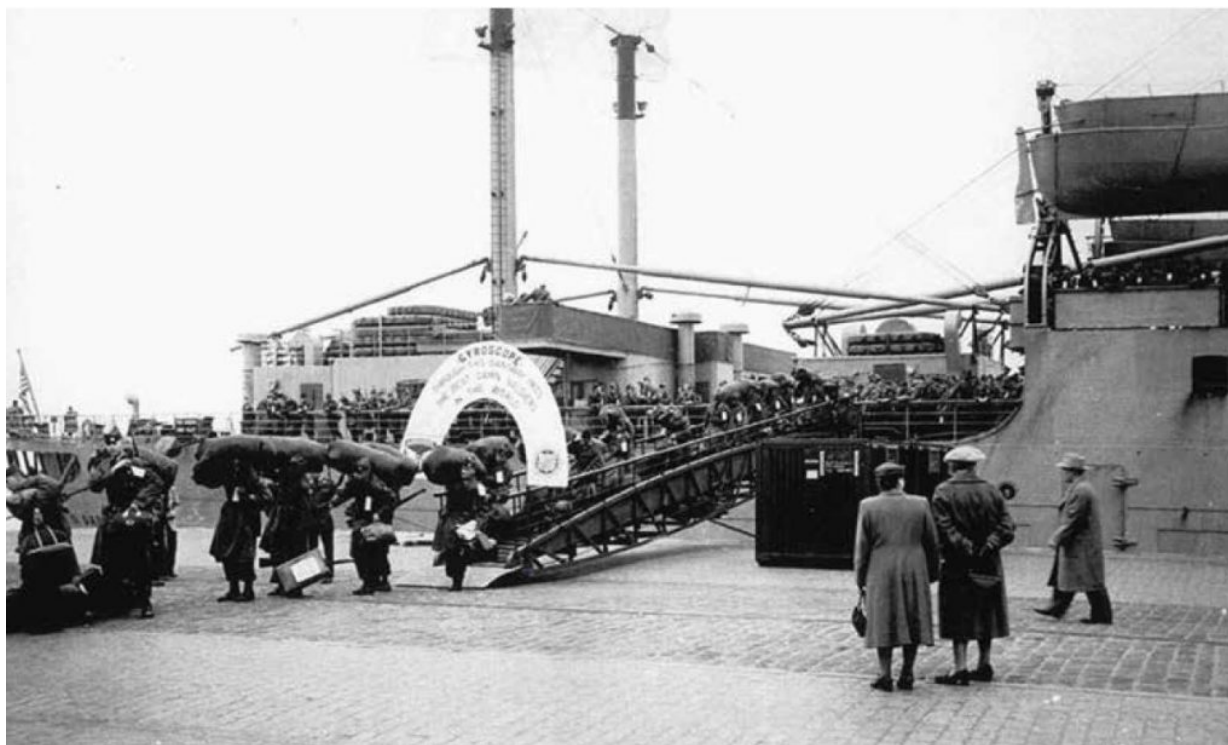
Рисунок 3 – Солдаты прибывают в Бремерхафен, Германия, 1947 год.

Приток солдат в Европу требовал регулярного и последовательного обучения тому, как реагировать на возможные нападения со стороны Советского Союза. Солдаты, дислоцированные в Германии на протяжении всей холодной войны, стремились поддерживать боевую готовность, необходимую для реагирования на чрезвычайную ситуацию в течение нескольких часов. Их распорядок дня и тренировки подготовили их к наихудшему сценарию, внезапному нападению. Память о нападении Японии на Перл-Харбор был еще свеж в памяти старших офицеров. Офицеры включили предотвращение внезапных нападений в учебные пособия и упражнения. Солдаты круглосуточно дежурили на наблюдательных пунктах на границе между Германией и Советским Союзом. Джипы и бронев автомобили ежедневно патрулировали всю границу, охватывая всю границу не менее двух раз в день, один раз днем и один раз ночью. Солдаты работали посменно по 12 часов не дальше десяти километров от границы на джипе с установленным ручным пулеметом 30-го калибра. Солдаты также установили постоянные и временные наблюдательные пункты, укомплектованные как минимум тремя солдатами: один солдат для наблюдения, один для записи любых заметных наблюдений и работы с радио, а третий для обеспечения безопасности.