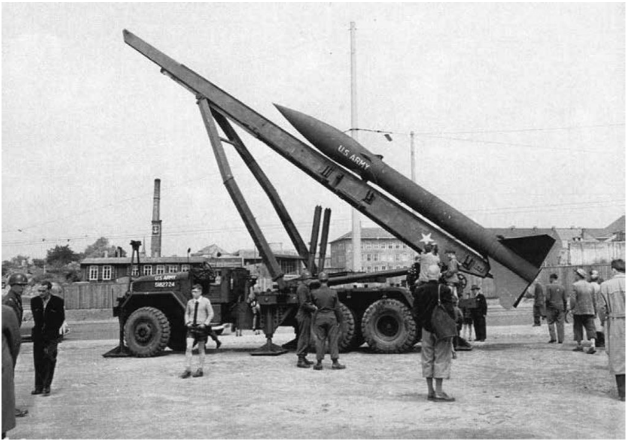
Рисунок 4 – Ракета «Честный Джон» на выставке в Дармштадте, Германия, май 1956 года. Центр военной истории

Кроме того, войска регулярно проводили серию тренировочных тревог и сборов, чтобы гарантировать, что солдаты смогут добраться до своих боевых позиций в кратчайшие сроки. Учения включали синхронизированную сборку личного состава и оборудования, упаковку и погрузку припасов и боеприпасов, а также перемещение всех в смоделированные места сбора. Требовалось, чтобы вся Седьмая армия начала движение к полю боя в течение двух часов после тревоги.