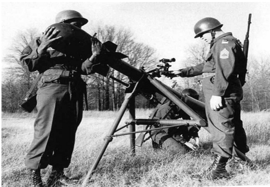
Рисунок 5 – Экипаж из трех человек готовится выстрелить из Дэви Крокетта в декабре 1959 года. Центр военной истории

В дополнение к большому ядерному оружию, такому как Honest John Rockets, армия также разработала меньшее и более портативное оружие, которое можно было быстро развернуть при столкновении с наступающей армией. Дэви Крокетт была первой переносной системой ядерного оружия в армии. Названное в честь народного героя Солдата и пограничника, это оружие предназначалось для ручной переноски и стрельбы экипажем из трех человек. Армия развернула первые системы Дэви Крокетта в районе Фульдского прохода в Западной Германии – ожидаемый маршрут вторжения советской наступающей армии. Это было смертельно для любого человека в радиусе четверти мили, а те, кто находился в радиусе 500 футов, подвергались достаточному облучению, чтобы умереть в течение нескольких минут или часов, даже под защитой бронированного танка. Это оружие должно было задержать наступающую армию, давая американским солдатам время для защиты.