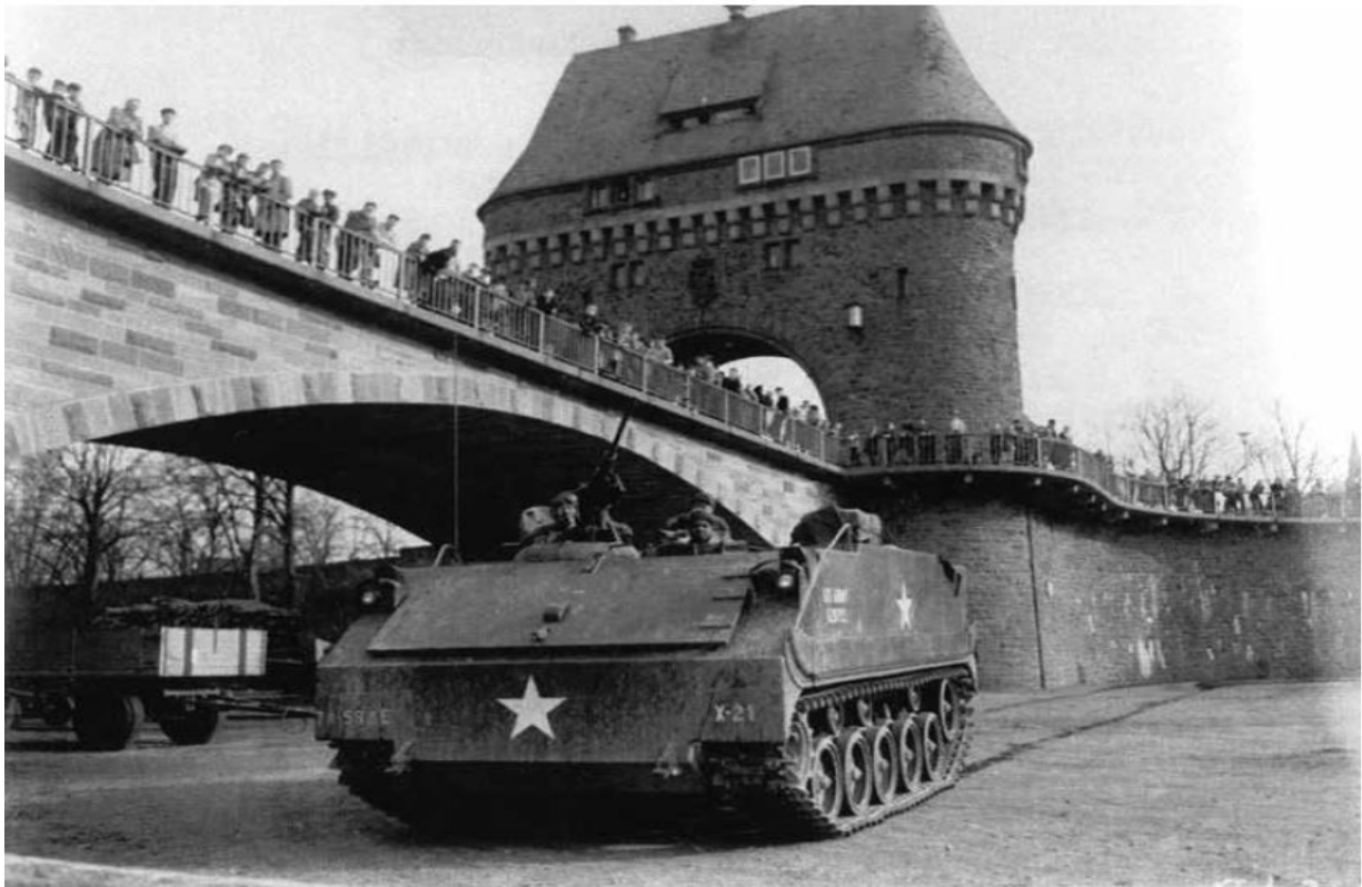
Рисунок 2 – Бронетранспортер М59 в Мильтенберге, Германия, во время учений, февраль 1958 года.

Столкнувшись с надвигающейся угрозой советского вторжения, сдерживание стало важным инструментом, используемым армией для борьбы с предполагаемыми угрозами холодной войны. В дополнение к этой политике сдерживания армия построила новые аванпосты в Европе и провела новые учения, направленные на борьбу с реалиями, созданными армией Советского Союза. На протяжении 1950-х годов армия США наращивала свое физическое присутствие в Германии. 10 сентября 1950 года президент Трумэн санкционировал существенное увеличение численности вооруженных сил США в Европе. Заявление президента укрепило приверженность Соединенных Штатов защите Европы и стимулировало усилия по увеличению американского присутствия на континенте. В то время Седьмая армия разместила свой штаб в Штутгарте, Германия, основной задачей которого было обучение и боевая готовность. 1 января 1951 г. Военная мощь Седьмой армии насчитывала более 44 000 солдат, а к концу года ее численность достигла более 160 000 солдат. Предоставление армией личного состава Германии продемонстрировало серьезность предполагаемой угрозы в то время [2].